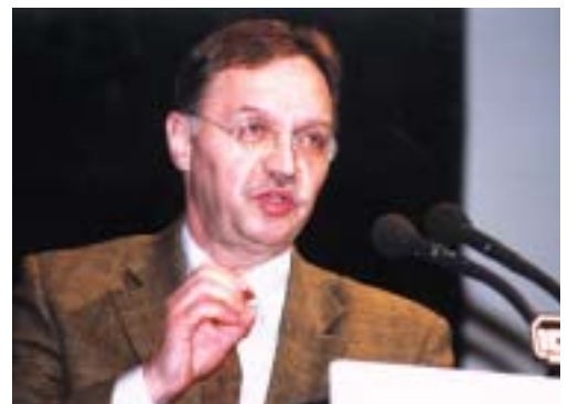
Den Hauptvortrag im Rahmen der Mitgliederversammlung hielt der Präsident des Deutschen Bauernverbandes, Gerd Sonneleitner, zum Thema „Qualität und Sicherheit – die Herausforderung für die Landwirtschaft“.