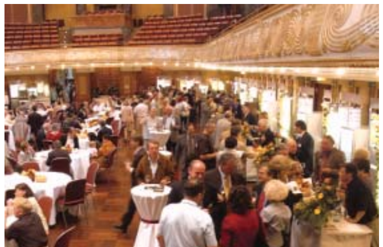
In stilvollem Ambiente konnten die Besucher die besten Weine von Deutschlands Top-Winzern verkosten.

Einen Tag nach der traditionellen Siegerehrung der Bundesweinprämierung wartete die DLG mit einer besonderen Premiere auf: Am 29. Juni 2002 fand im Kurhaus die erste "Wein & Culinaria" statt als Festival Deutscher Spezialitäten. Damit will die DLG in ihrer Verbraucherkommunikation neue Akzente setzen.