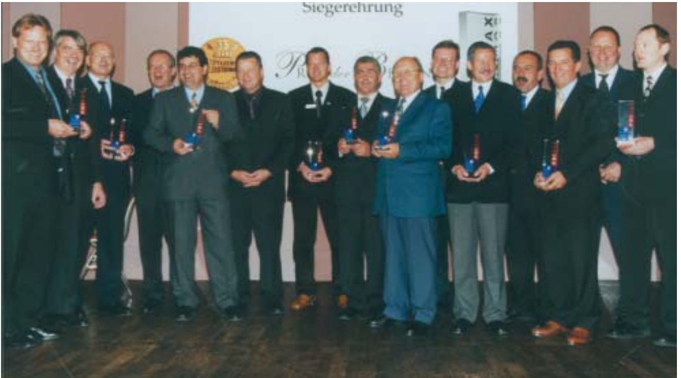
Im Rahmen der Fachmesse „InterMopro“ in Düsseldorf wurde der PriMax verliehen, die Spitzenauszeichnung für die internationale Milchbranche. Das Bild zeigt DLG-Präsident Philip Freiherr von dem Bussche (2.v.l.) mit allen Preisträgern.