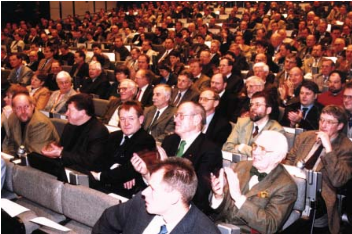
„Volles Haus“ bei der großen Vortragstagung: Über 800 Teilnehmer füllten den Saal im Internationalen Congress Centrum in Berlin bis auf den letzten Platz.