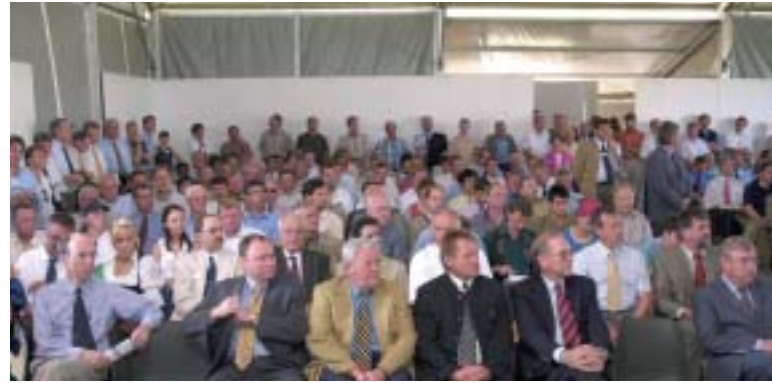
Volles Haus auch bei der Eröffnung der DLG-Feldtage auf Gut Hellkofen.