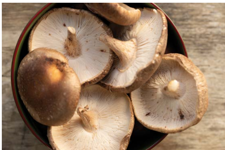
Abbildung 2: Braune Kulturchampignons