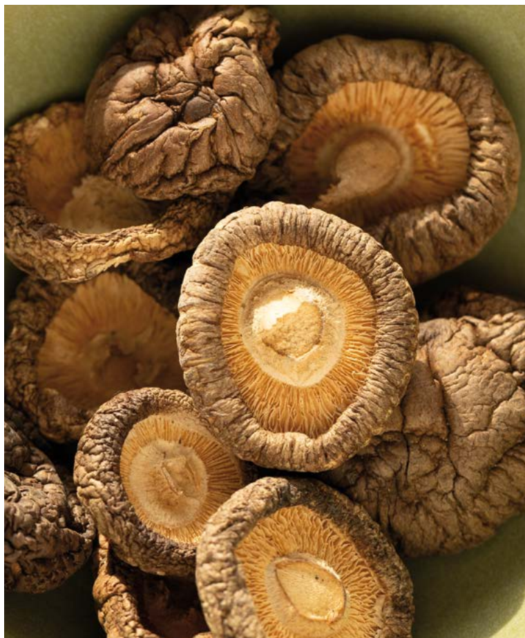
Abbildung 1: Getrocknete, geräucherte Shiitake Pilze

Während Pilze insgesamt eine gute Nährstoffquelle darstellen, wird ihr Eiweißgehalt oft überschätzt. Dieser liegt bei 1,6g Protein pro 100 g rohem Shiitake oder bei 4,2 g Eiweiß pro 100 g rohem Champignon (Nutritional Software). Die wahre Verdaulichkeit des Pilzproteins variiert zudem von Pilz zu Pilz (Ionescu et al 2025). Den Proteinbedarf mit Pilzen zu decken funktioniert daher nicht.