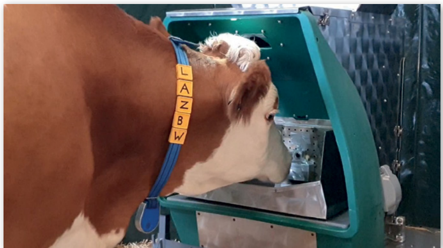
Abbildung 3: Blick in das GreenFeed-System als Kraftfutterabrufstation mit geschütztem Kopfraum zur Erfassung der Atemluft der Milchkuh und obenliegenden Absaugkamin

Weil der \text{CH}_4 -Ausstoß im Tagesverlauf nicht konstant ist, werden täglich mehrere Besuche pro Kuh an den GreenFeedern angestrebt. Von den verschiedenen klassischen Referenztechniken für \text{CH}_4 -Messverfahren scheint das GreenFeed-System (GF; C-Lock Inc.) am besten für den Einsatz in landwirtschaftlichen Betrieben geeignet zu sein, da es einen hohen Durchsatz an Tieren ermöglicht und über lange Zeiträume messen kann. Die erfassten Daten werden online an die „Firma“ weitergeleitet und der Nutzer erhält die konkreten Daten zum \text{CH}_4 -Ausstoß des